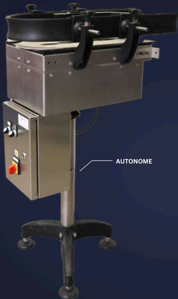
Table d'accumulation de rebuts.